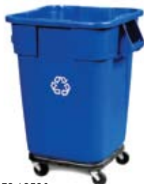
3536-73 / 3530