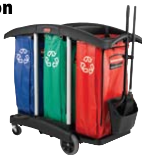
9T92 Vea la pág 115 para información de cómo ordenar