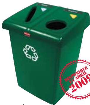
ESTACIÓN DE RECICLAJE DE DOS VARIANTES GLUTTON®