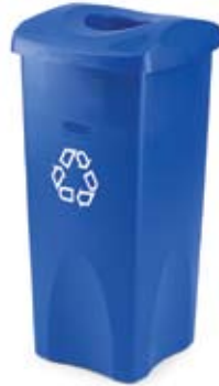
3569-73 / 2691