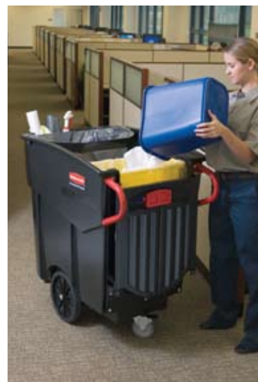
9W73 Colector Móvil Mega BRUTE®