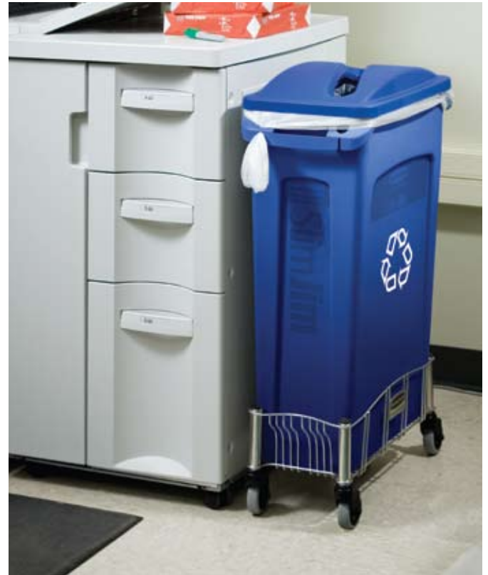
3540-07 / 2703-88 / 3553 (vea página 14)