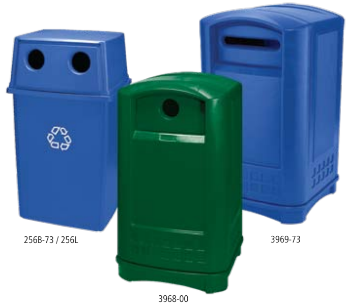
256B-73 / 256L

Los productos de RCP que apoyan las prácticas de sustentabilidad y contienen materiales reciclados postconsumidor están marcados con esta hoja en este catálogo de productos.